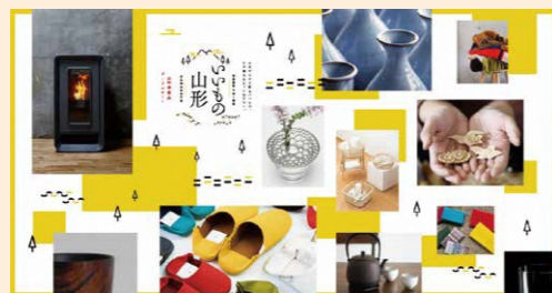
ポータルサイト「いいもの山形」