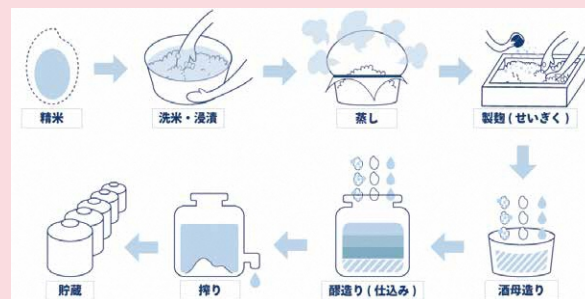
日本酒の製造工程

また、山形県は全国第4位の日本ワインの生産地でもあり、日本ワインコンクールなど国内外の品評会で高い評価を受けているほか、近年は新たなワイナリーが複数設立されています。