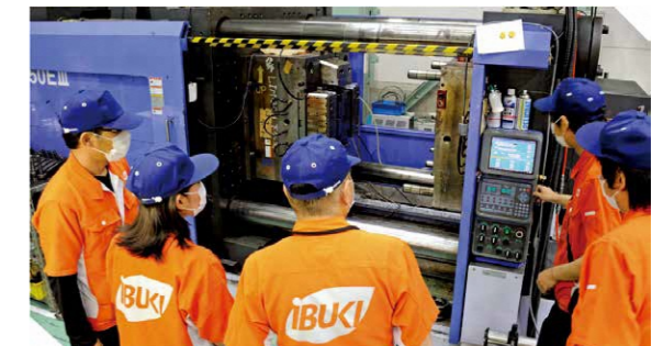
社員同士が意見を出し合いながら金型をチェック

働く社員の方からのメッセージ 自分が手掛けた製品でお客様が喜んでくれる事が何よりもうれしいです。 金型づくりは、ものづくりの原点なので、社会の中で大きな役割を担っていることを誇りに思います。